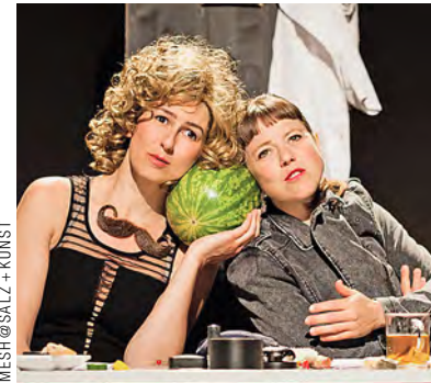
MESH @SALZ + KUNST